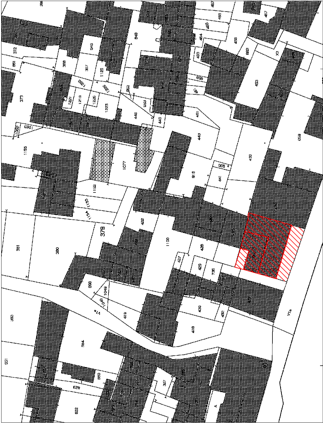
ESTRATTO DI MAPPA CATASTALE - FOGLIO N. 3 - PART. N. 379 SCALA 1:750